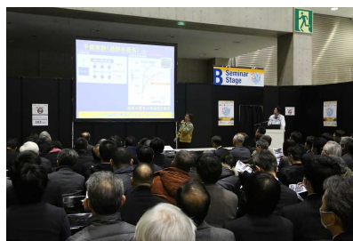
受賞者によるプレゼンテーション