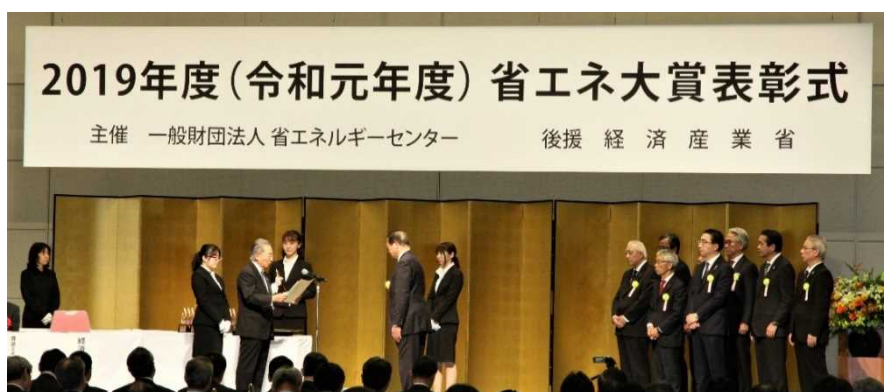
昨年度の表彰式（2020年1月29日：東京ビッグサイト）

本表彰事業は、事業者や事業場等において実施した他者の模範となる優れた省エネ取り組みや、省エネルギー性に優れた製品並びにビジネスモデルを表彰するものです。この表彰事業では、公開の場での審査発表会や受賞者発表会、さらには全応募事例集や受賞製品概要集などを通じ、情報発信や広報を行うことにより、わが国全体の省エネ意識の拡大、省エネ製品の普及などによる省エネ型社会の構築に寄与することを目的としています。