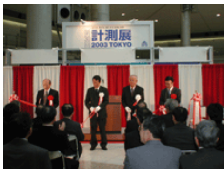
開会式：テープカット